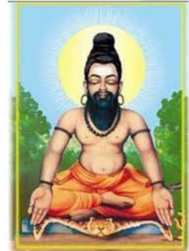
மகத்துவம் பொருந்திய அகத்திய முனிவர்

அதுமட்டுமல்ல, அட்டமாசித்தி பெற்ற பதினெண் சித்தர்களில் ஒருவர் அகத்தியர் என்றிருந்தார். அவர்தான் சித்த மருத்துவ முறையை வகுத்தவர்களின் தலையாயவர் எனவும், ஆயுர்வேத சூத்திரங்களுக்கு விரிவுரை எழுதியிருக்கிறார் எனவும் கூறுவர்.